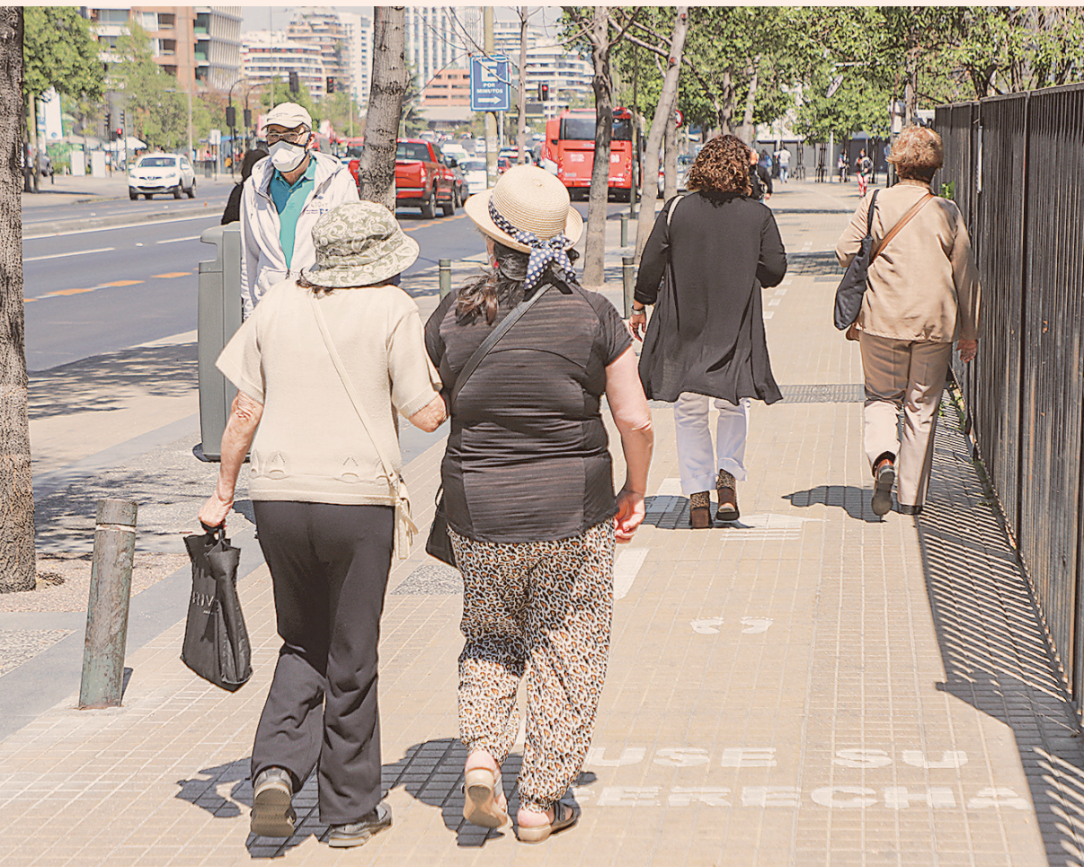
Los pensionados que optan por la renta vitalicia, ceden sus fondos de pensiones bajo un contrato a la aseguradora a cambio de una renta mensual en UF hasta su muerte.

“En el caso de los (inversionistas) extranjeros, podrían iniciar un arbitraje en contra del Estado de Chile ante el Ciadi, solicitando la compensación de los daños causados”, dice el abogado José Luis Corvalán